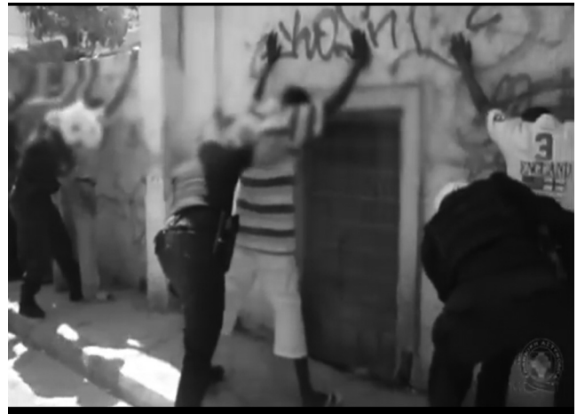
Εικόνα 1. «29-05-2013. Αστυνομική επιχείρηση σε περιοχές του κέντρου της Αττικής» 2 .

Ως επί το πλείστον πρόκειται για την απεικόνιση μίας ρουτίνας που περιλαμβάνει περιπολίες, ελέγχους, προσαγωγές, χωρίς να προβάλλεται άσκηση φυσικής βίας 3 . Η έμφαση δίνεται στον επίμονο και επαναλαμβανόμενο έλεγχο της νομιμότητας, στον έλεγχο των αντικειμένων που οι μετανάστες φέρουν και στο γεγονός ότι πρόκειται για επιχειρήσεις που αφορούν ταυτόχρονα μεγάλο αριθμό υπόπτων. Κατά συνέπεια, εντοπίζουμε ως τεκμήρια της απειλής την παράνομη παρουσία, το παράνομο εμπόριο αλλά και απλά το ίδιο το πλήθος, με άλλα λόγια την ίδια την παρουσία των μεταναστών.