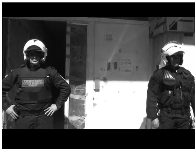
Εικόνα 6. «Έλεγχοι της ΕΛ.ΑΣ. στο κέντρο της Αθήνας».

Τα αστυνομικά μέτρα τα οποία καλούνται να αποκαταστήσουν το αίσθημα ασφάλειας καλύπτουν ένα αρκετά μεγάλο εύρος αντιμετώπισης των απειλών, από τον συνήθη έλεγχο νομιμοποιητικών εγγράφων, μέχρι τη μεγάλη κλίμακας δεύτερη «αστυνομική επιχείρηση στη Βίλα Αμαλία». Κοινό σημείο είναι η αποφυγή δημοσιοποίησης εικόνων χρήσης βίας. Ωστόσο η δυνατότητα άσκησης βίας υπονοείται από την απεικόνιση του αστυνομικού εξοπλισμού και από την εστίαση σε επιβλητικά σώματα αστυνομικών που είναι πιθανόν να ποζάρουν για αυτόν τον σκοπό.