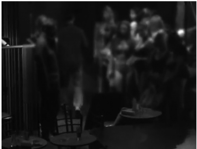
Εικόνα 4. «Επιχείρηση για έλεγχο νυχτερινών κέντρων strip show».

ζει. Δεν πρόκειται μόνο για εν δυνάμει μέσα άσκησης βίας (μπουκάλια, κοντάρια κλπ), αλλά και για αντικείμενα που καταδεικνύουν την πολιτική ταυτότητα των καταληψιών (αφίσες, προκηρύξεις, ακόμα και βιβλία), όπως και για υποδομές και εξοπλισμό που επιτρέπει την επεξεργασία και τη διακίνηση ιδεών (συνθήματα και γκράφιτι στους τοίχους, υπολογιστές, ραδιοπομπός, τυπογραφείο). Σε κάποιο βαθμό, η απειλή έγκειται στη συνολική εικόνα του χώρου, είτε αυτή αφορά απεικονίσεις ακαταστασίας και φθοράς, είτε απλά την ίδια τη