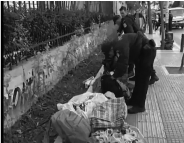
Εικόνα 2. «Αστυνομική επιχείρηση κατά του παρεμπορίου στην ΑΣΟΕΕ».

άτυπων πρακτικών (κατοίκησης, εργασίας, κοινωνικής συναναστροφής) των μεταναστών να εικονογραφείται ως απειλή ασφαλείας, από τη στιγμή που είναι αυτές ακριβώς οι πρακτικές που διακόπτονται και καταστρέφονται από τις αστυνομικές επιχειρήσεις.