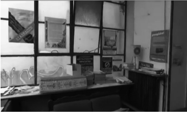
Εικόνα 5. «Επιχείρηση στο υπό κατάληψη κτίριο Βίλα Αμαλία».

μετατροπή της χρήσης του χώρου και τις λογής υποδομές αξιοποίησης και κατοίκησης. Κρίνοντας από τα ίχνη που αφήνουν πίσω τους, οι καταληψίες είναι επικίνδυνοι καθότι βίαιοι, ακατάστατοι και φθοροποιοί , αλλά και επιπλέον ως κάτοχοι ύποπτης πολιτικής ταυ-