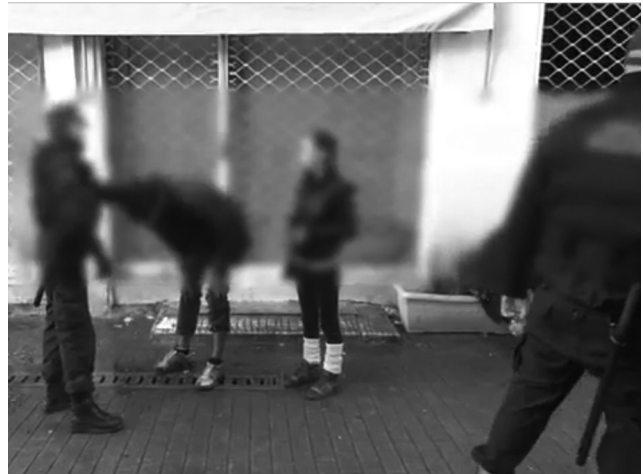
Εικόνα 3. «18-12-12. Έλεγχοι για ναρκωτικά στο κέντρο της Αθήνας».

Αντίθετα, στα βίντεο που αφορούν τις καταλήψεις διαπιστώνεται λιγότερο έντονη σωματοποίηση της απειλής. Οι καταλήψεις εμφανίζονται σπάνια 4 . Τεκμήρια της παρουσίας τους και της απειλής που συνιστούν γίνονται τα είδη των αντικειμένων όπου ο φακός εστιάζει.