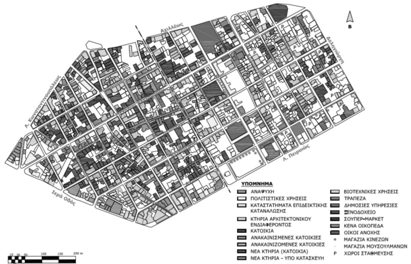
Χάρτης 2: Χρήσεις γης στο Μεταξουργείο, καλοκαίρι 2013, προσωπική καταγραφή

εταιρείας Oliaros με την τοπική και την κεντρική εξουσία, εταιρεία η οποία κατέχει περίπου το 4% των ακινήτων της περιοχής το οποίο χρησιμοποιείται μέχρι τώρα (2013) μόνο για καλλιτεχνικές δράσεις και εκθέσεις, θεσμοθετούνται φορολογικά κίνητρα για την αποκατάσταση νεοκλασικών κτηρίων, εντατικοποιείται η αστυνόμευση και