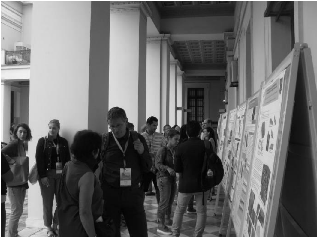
Η συνεδρία των poster στο αίθριο του κεντρικού κτιρίου του Εθνικού και Καποδιστριακού Πανεπιστημίου Αθηνών.