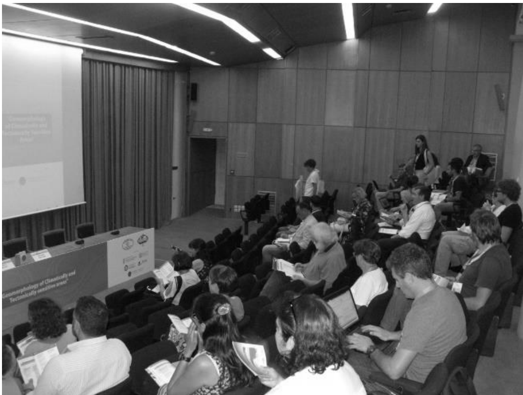
Από τη συνεδρία «Τεκτονική Γεωμορφολογία».