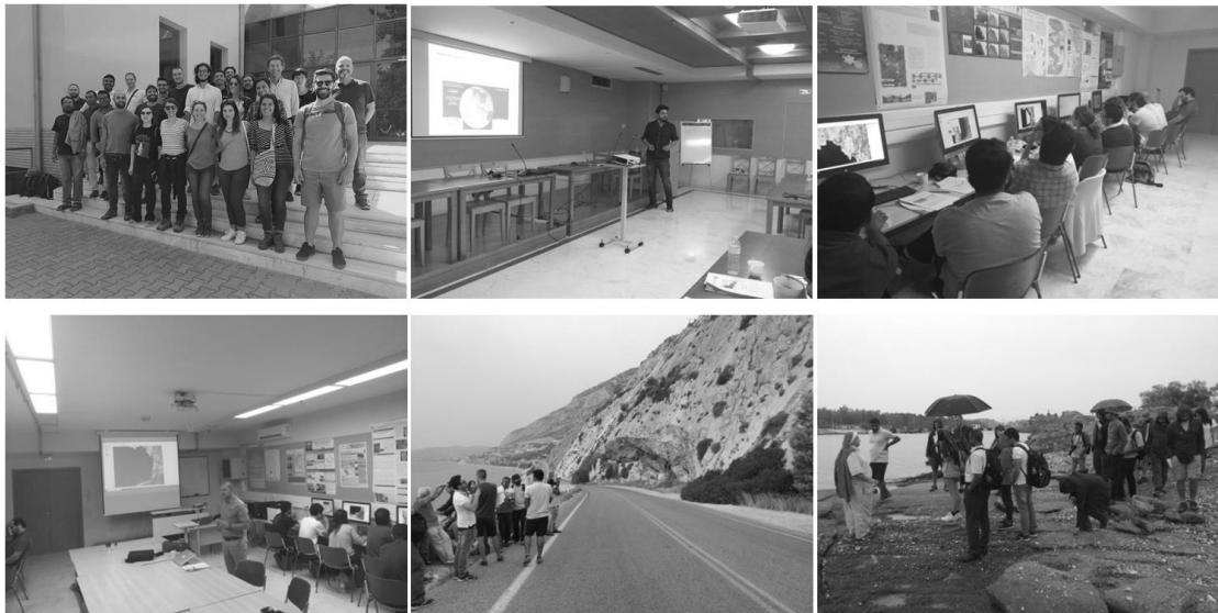
Φωτογραφίες από τις δραστηριότητες του μετασυνεδριακού εντατικού σχολείου για νέους γεωμορφολόγους με θέμα «παράκτια γεωμορφολογία κλιματικά και τεκτονικά ευαίσθητων περιοχών» που διοργανώθηκε από την Διεθνή Ένωση Γεωμορφολόγων (IAG) και την Ευρωπαϊκή Ένωση Γεωεπιστημών (EGU).