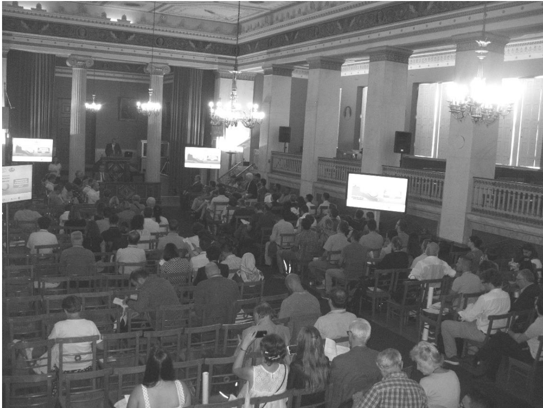
Η έναρξη του συνεδρίου στην αίθουσα τελετών του ιστορικού κεντρικού κτιρίου που Εθνικού και Καποδιστριακού Πανεπιστημίου Αθηνών.