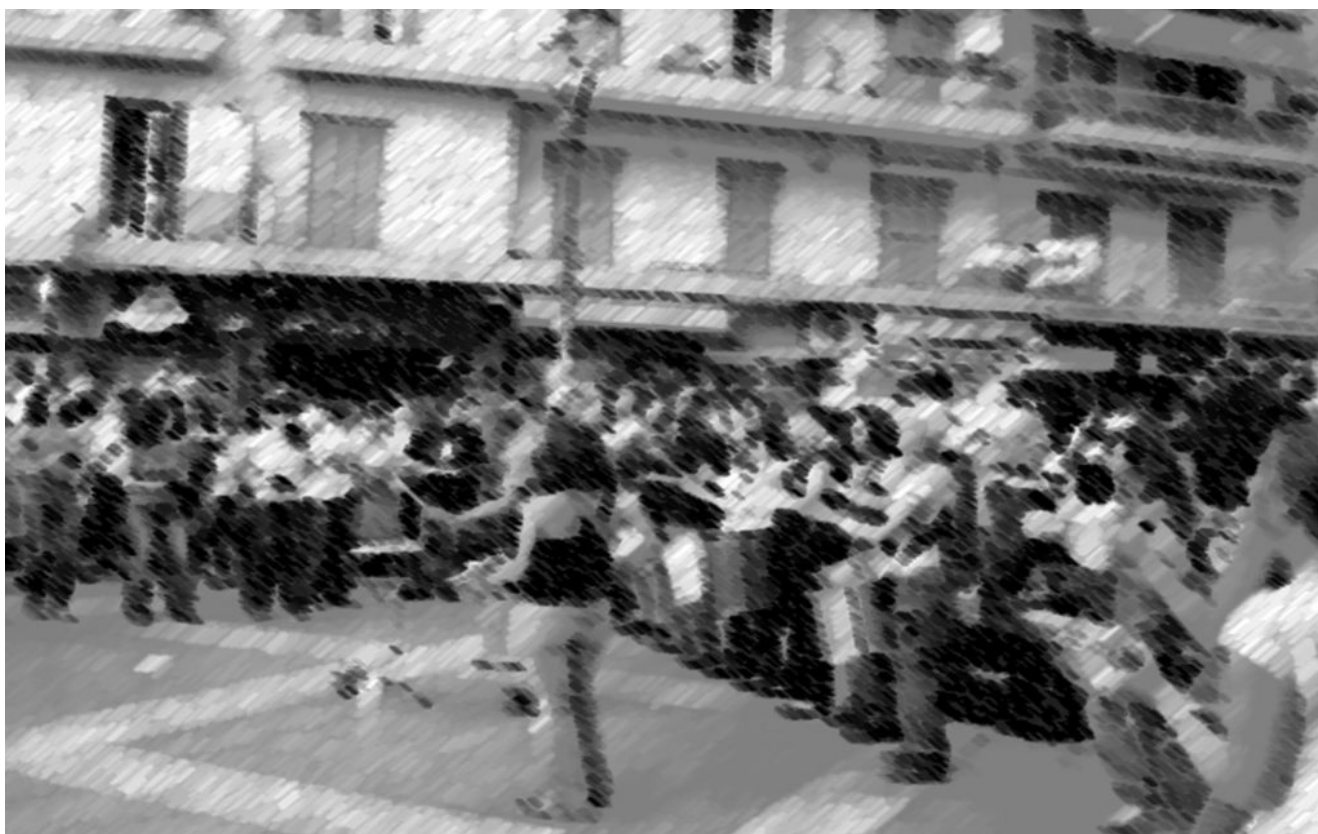
Εικόνα 3: Αυθόρμητες εκδηλώσεις υποστήριξης της βιωμένης αστικής ζωντανίας από πολίτες (ίδια επεξεργασία φωτογραφίας)

πολιτική διαπραγμάτευση της τοπικής ανάπτυξης με την ευρεία συμμετοχή του κοινού θεωρείται στοιχείο καθυστέρησης, παρά προσανατολισμού, εμπλουτισμού ή συνθήκη διασφάλισης της προωθούμενης επένδυσης. Εντούτοις, αναπτύσσεται κατά τόπους άτυπα, με την καθημερινή αμφισβήτηση «από τα κάτω» (άτυπες ομάδες ενεργών πολιτών που αναδεύουν τις εγκατεστημένες συνθήκες, νέα κινήματα που δρουν το «δικαίωμά τους στην πόλη»). Μερικές φορές με συμμετοχικές καινοτομίες στην επίσημη αστική διαχείριση, τοπικές αρχές πειραματίζονται με την ενεργοποίηση των πολιτών στον δημόσιο χώρο ή συνασπίζονται με ιδιωτικούς εταίρους (Athanassiou et al 2018)