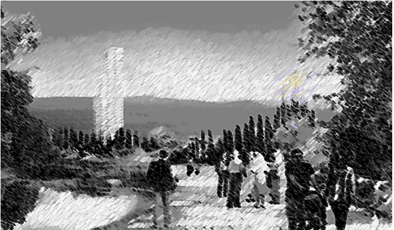
Εικόνα 1: Ο δημόσιος χώρος στο πρώτο πλάνο προβολής της ανάπτυξης του Ελληνικού (ίδια επεξεργασία τρισδιάστατης απεικόνισης)

Σύμφωνα με νεότερες προσεγγίσεις, αυτή η τάση συνοδεύεται από μια ενορχηστρωμένη τακτική αναζωογόνησης «μαλακών χώρων» (soft spaces), με εναλλακτικές «ασαφείς οριοθετήσεις» (fuzzy boundaries) (Allmendinger & Haughton 2008, 2009, 2010, Haughton et al 2010) η οποία δεν ανταποκρίνεται σε επίσημα διοικητικά όρια και αρμοδιότητες, ούτε επιχειρεί να τα χειριστεί άμεσα. Πρόκειται για ανάδειξη «νέων υπο-περιοχών με πολυάριθμες χωρικές ενότητες στην ανάπτυξη στρατηγικών και την εφαρμογή πολιτικών, που προκύπτουν σε διάφορες κλίμακες σχεδίων αναζωογόνησης ή χωρικού σχεδιασμού, οι οποίες απαγκιστρώνονται από ακαμψίες που σχετίζονται με τις επίσημες κλίμακες του θεσμοθετημένου σχεδιασμού και από τα δεσμά προϋπαρχόντων προτύπων εργασίας τα οποία θεωρούνται από διάφορες πλευρές, αργά, γραφειοκρατικά και ότι δεν αντανακλούν πραγματικές γεωγραφίες προβλημάτων και ευκαιριών» (Allmendinger & Haughton, 2009: 619).